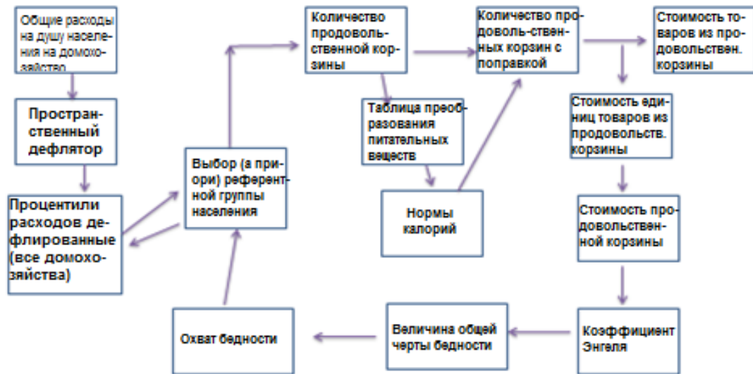
Диаграмма 1. Метод определения стоимости основных потребностей